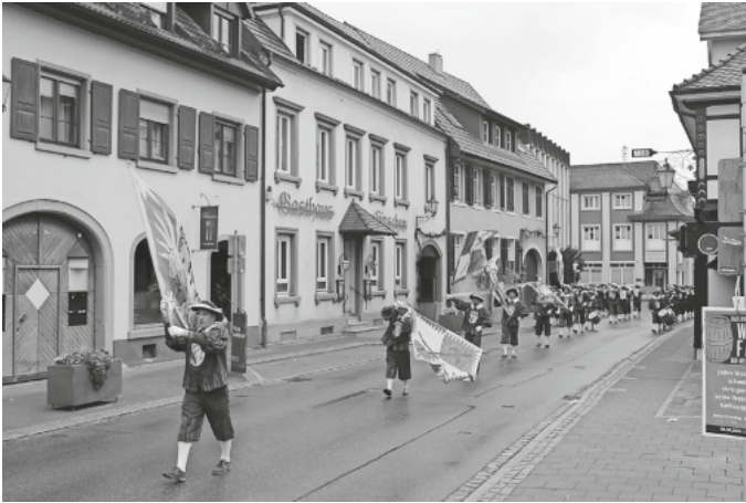
Der Fanfarenzug weckt die Bachenstraße

sich gerne über info@fanfarenzug-ihringen.de oder bei einem Musiker persönlich melden.