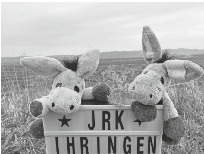
JRK Ihringen Esel Maskottchen