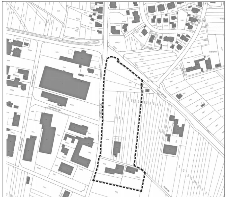
Abgrenzung Geltungsbereich (ohne Maßstab)

Die genaue Abgrenzung des Geltungsbereichs der 22. punktuellen Änderung des Flächennutzungsplanes ist aus folgendem Lageplan ersichtlich: